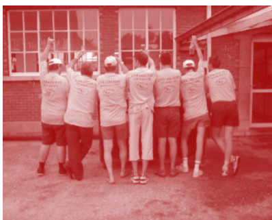
Bij een pintje napraten over de hete, maar geslaagde kermisjogging van 2003.

Ons jubileumjaar is achter de rug. Op naar een nieuw fantastisch jaar.