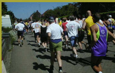
Vertrek kermisjogging 2002.

Indien goed zichtbaar opgehangen, Ten minste houdbaar tot oktober 2003